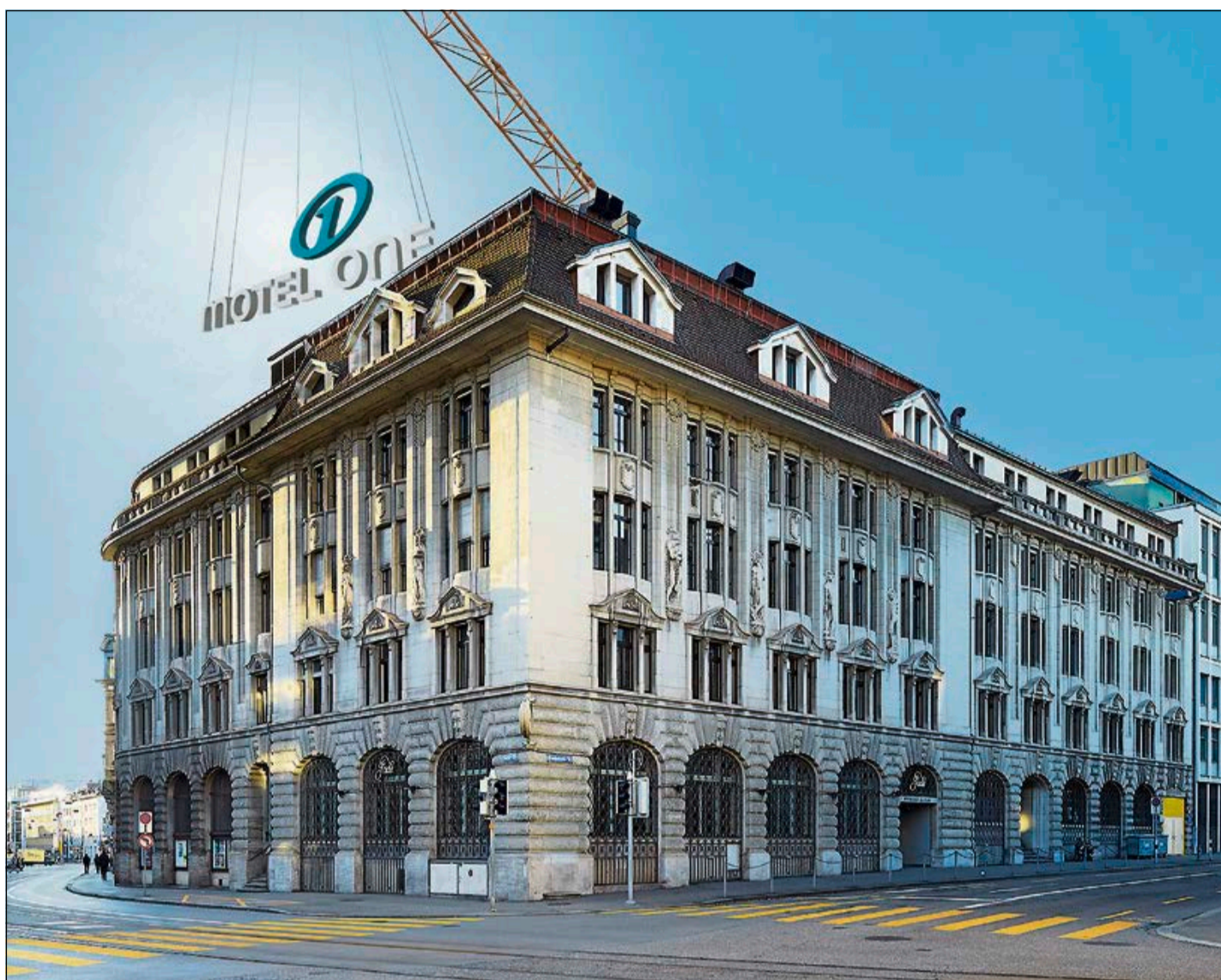
Im Gebäude der einstigen Zürcher Post Selnau soll mit 420 Zimmern eines der grössten Hotels in der Schweiz entstehen.

Mit ein Grund für die Verspätung dürfte die nicht ganz einfache Konstellation des Baukörpers sein. Für das Hotel ist ein Umbau von insgesamt vier Gebäuden nötig, welche teilweise unter Denkmalschutz stehen. Zusätzlich nicht näher genannte «Optimierungen» ziehen das Vorhaben ebenfalls in die Länge. Zumal man derzeit noch immer im Bewilligungsverfahren steckt. Die