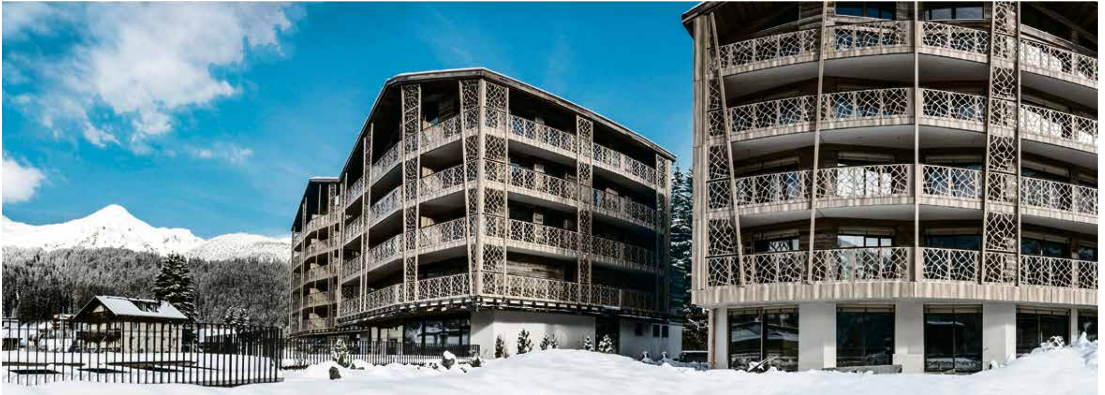
Ein enormer Gewinn für Arosa: Das Valsana Hotel & Appartments wird am 7. Dezember wiedereröffnet