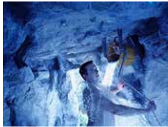
Wellness-Erlebnisse: Eisgrotte im Spa des Waldhotel Doldenhorn